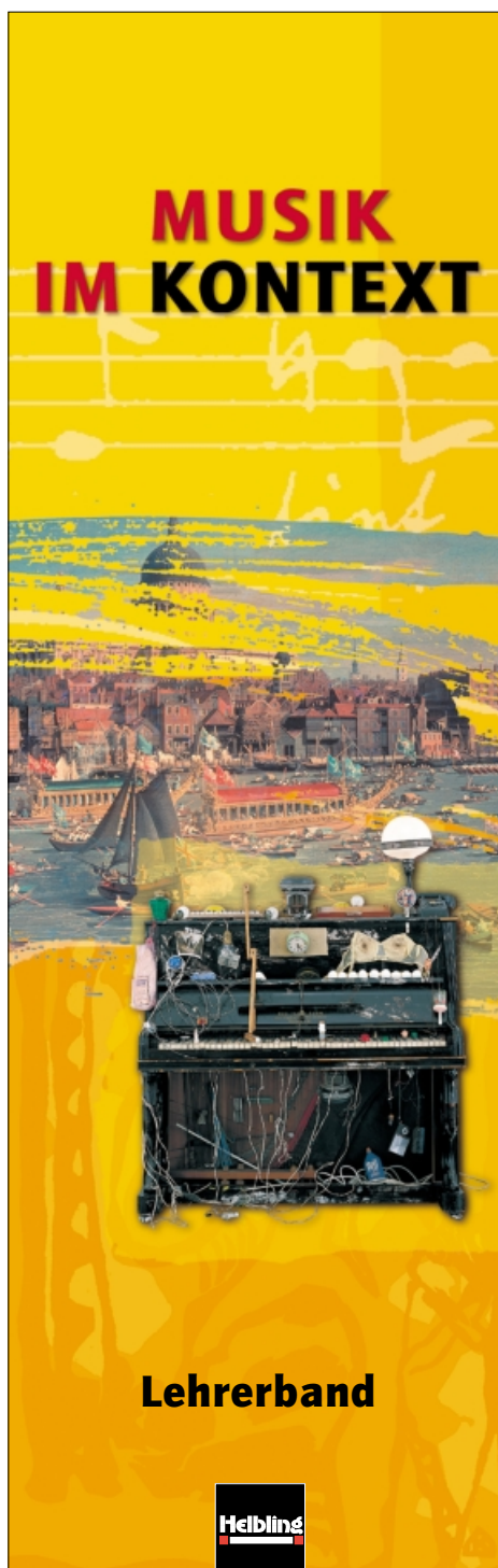
61,5 x 192 mm zum Aufkleben