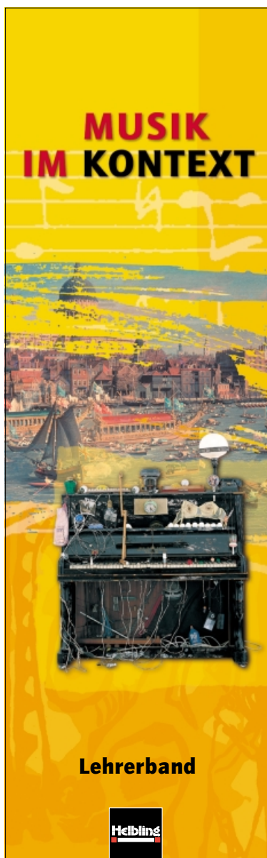
49 x 158 mm zum Einstecken

Sie können sich die Ordner-Rückenschilder auf Papier, Karton oder selbstklebende Folie ausdrucken. Darüber hinaus können Sie die auf der Website ebenfalls angebotenen JPEG-Dateien in eine der in „WORD“ enthaltenen Etikettenvorlagen integrieren (Menüleiste: „Extras“/„Umschläge und Etiketten“/„Optionen“) und auf spezielle selbstklebende Blanko-Rücken drucken.