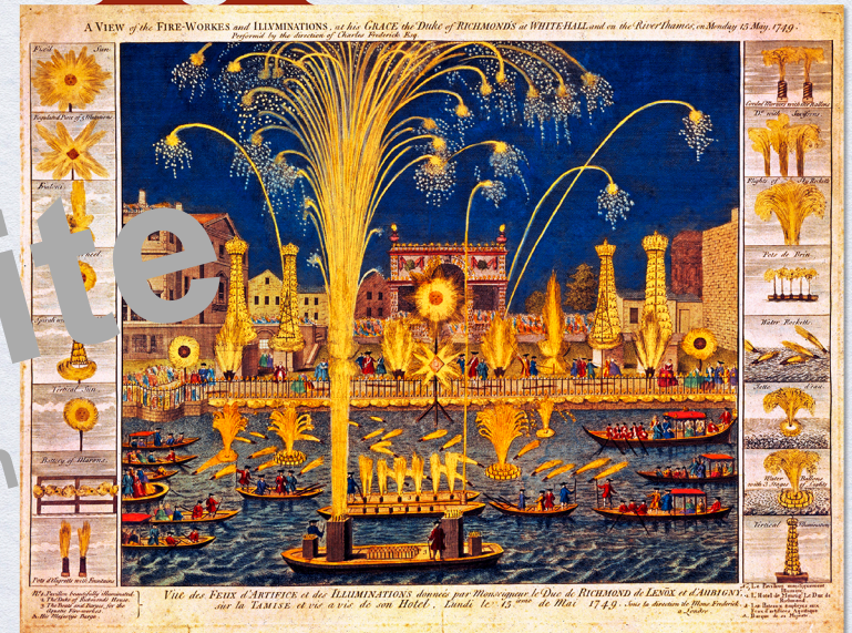
Friedensfeier mit Feuerwerk auf der Themse, zu dem Händels Feuerwerksmusik erklang (1749)