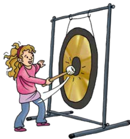
Katharina Rottler: Immer muss ich warten!

Gong heißt „Ich kenn ich aus der Schule“, denn du hast es schon gehört. Aber hast du schon einmal von dem Instrument gehört, das in einem Orchesterstück vorkommt? Ein Gong ist ein Schlaginstrument, das aus einer runden Metallplatte besteht, die am Rand aufgehängt wird. Es gibt große und kleine Gongs, deren Platte entweder flach oder gewellt ist. Je nachdem, wie die Platte angeschlagen wird, kann sie unterschiedlich klingen.